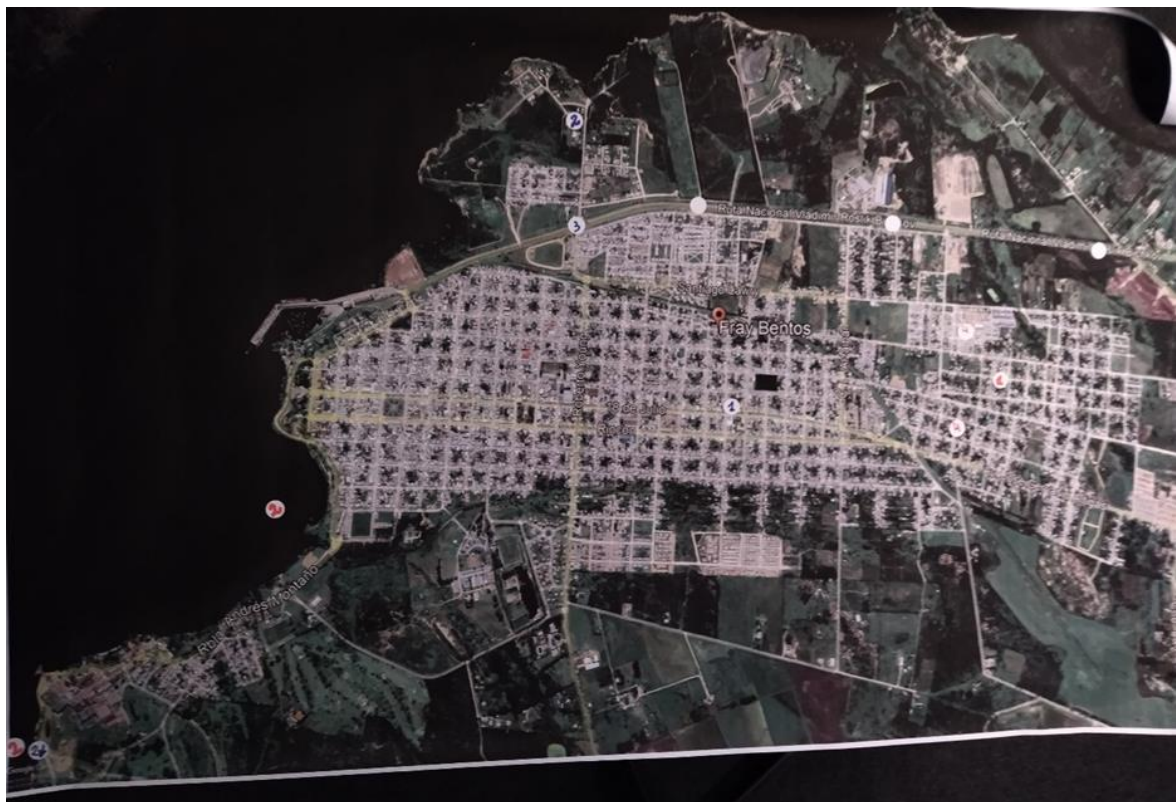
Figura 1: Mapa del Grupo A