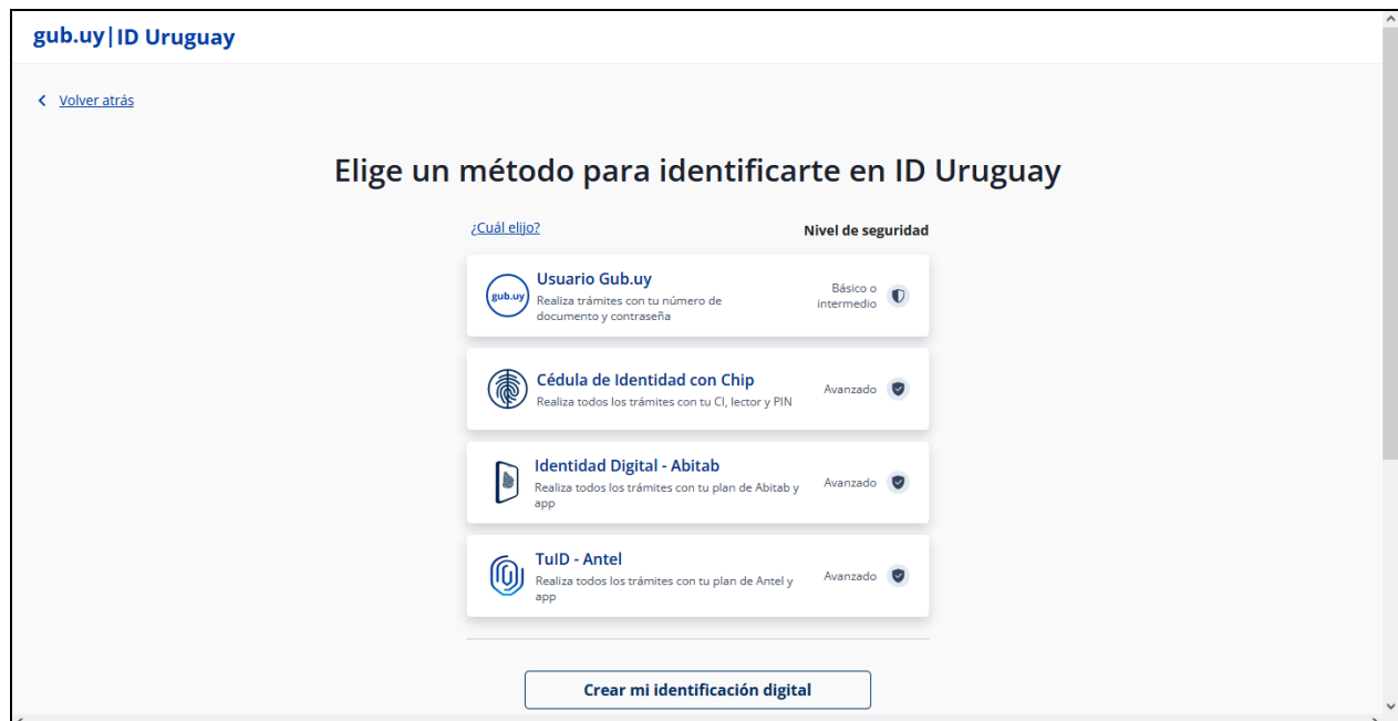
Figura 2 – Pantalla de autenticación

Al autenticarse en el sistema se accederá a la pantalla de la figura 3 (pantalla inicio):