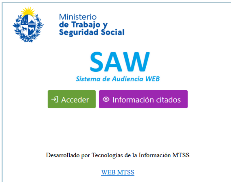
Figura 1 – Pantalla de acceso

En la pantalla de acceso, se deberá elegir la opción Acceder a los efectos de solicitar y gestionar solicitudes de audiencia.