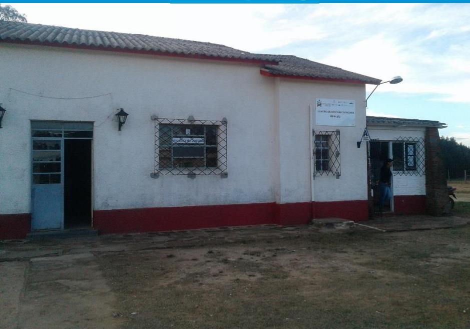
Proyecto piloto en localidad de Arévalo- Cerro Largo